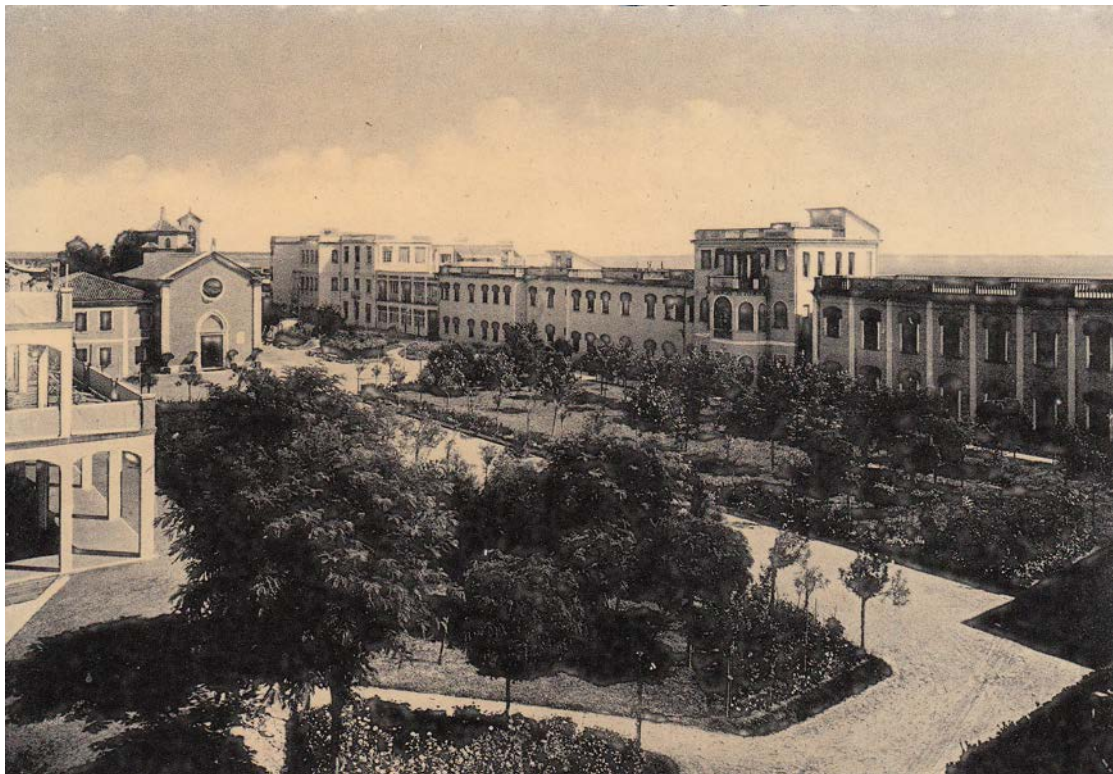
L'Ospedale al Mare anni 50

La memoria di ieri stride con la storia di oggi. La consapevolezza del valore climatico e terapeutico dell'Ospedale al Mare, ora abbandonato al degrado e della sua spiaggia, che si è tentato persino di trasformare in una darsena per yacht, forse potrà suggerire uno sviluppo sostenibile e compatibile con il patrimonio ambientale del Lido e di Venezia.